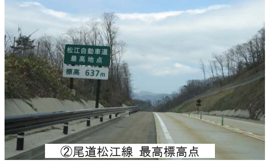
②尾道松江線 最高標高点

まずは、尾道北インターチェンジすぐ北側の御調川橋(みつぎがわばし)です。尾道方面から松江方面へ走行すると、橋の手前でカーブしているので、本線走行中に整然と並んだ橋脚がきれいにご覧いただけます。