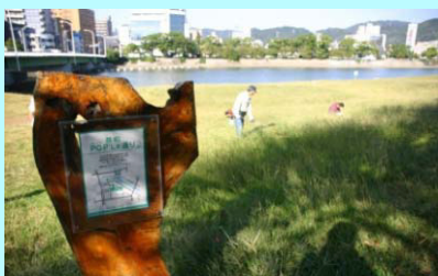
市民団体による看板設置事例（太田川）