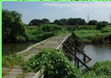
ピオトープの整備