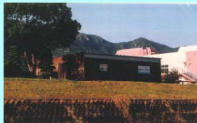
市民団体による活動拠点の整備事例（佐波川）

※ 河川管理者から河川管理施設の維持、除草等の委託を受けることも可能となります。委託先については、公募等の適正な手続きを経て選定を行う予定です。