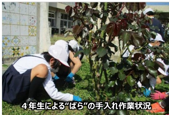
4年生による“ばら”の手入れ作業状況