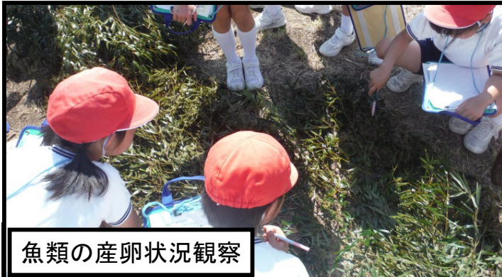
魚類の産卵状況観察