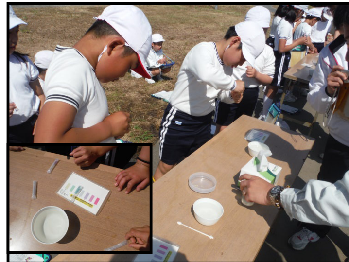
パケットによる水質測定