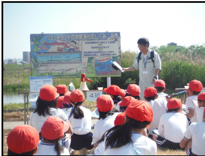
ウェットランドの概要説明