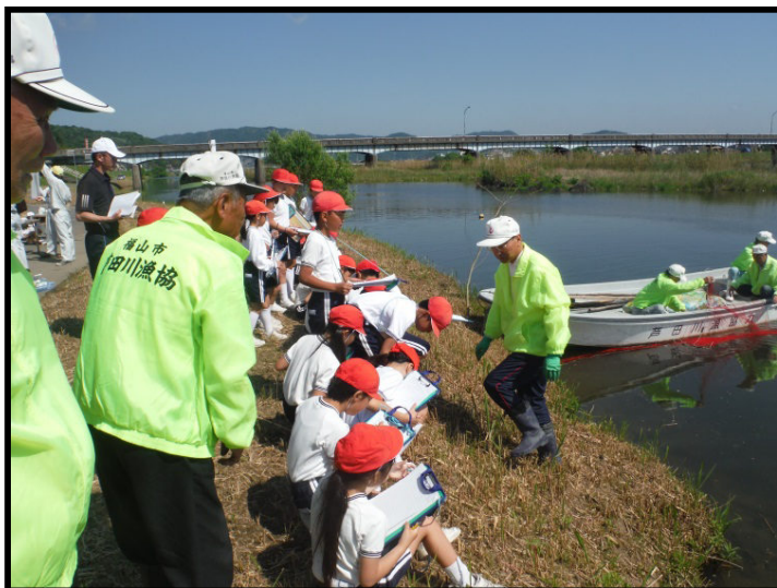
芦田川漁業協同組合協力による魚類の産卵状況等の観察