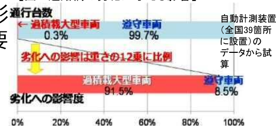
【図 道路橋の劣化に与える影響】

基準の2倍以上の重量超過の悪質違反者に厳罰化⇒現地取締りで違反を確認した場合は告発(レッドカード)