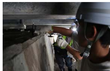
H30 構造物点検(深津橋)