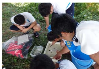
H30 河川の水生物調査