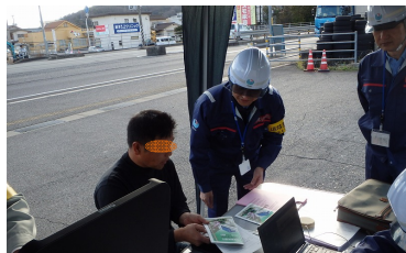
運転手への呼びかけ状況