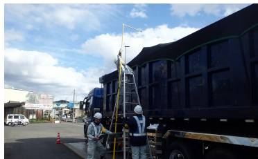
車両寸法計測状況