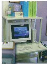
② 氾濫シミュレーション用パソコン 芦田川・高屋川の治水(ちすい)状況、災害知識、芦田川概要(がいよう)などを紹介しています。(CDの貸出しもできます。)

<その他の3階の展示> ●展示絵画/芦田川風景画など ●展示パネル/浄化パネル、写真集、作文集など ●ホール/高屋川河川浄化施設展望(てんぼう)スペースとして自由に使用していただいています。