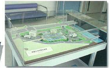
⑥ 高屋川河川浄化施設模型 高屋川と当施設の位置関係を表しています。

<その他の3階の展示> ●展示絵画/芦田川風景画など ●展示パネル/浄化パネル、写真集、作文集など ●ホール/高屋川河川浄化施設展望(てんぼう)スペースとして自由に使用していただいています。