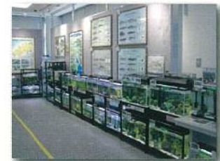
③ 各種魚水槽 ※こちらの展示配置は、適宜変更致します。