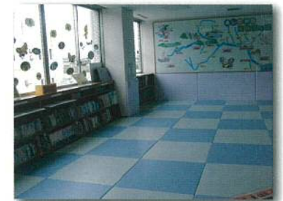
④ ライブラリー 閲覧(えつらん)できる図書約600冊を設置しています。また、芦田川・高屋川等に関するビデオも設置しており、自由に学び・遊べる場として開放しています。

<その他の1階の展示> ●展示パネル/芦田川の歴史、治水、生物、水質などを展示しています。 ●パンフレット/配布用、閲覧(えつらん)用