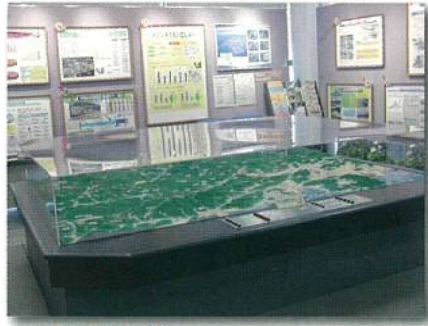
① 芦田川流域模型 雨が芦田川に流れこむ範囲(はんい)を表しています。