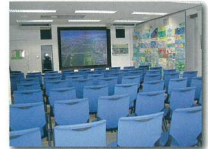
⑤ 見学説明室 ※レイアウト変更適宜有り 芦田川の概要や高屋川浄化施設の説明、バックテスト体験を必要に応じて行っています。