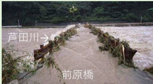
府中市父石町付近（平成30年7月豪雨）

平成30年7月豪雨の芦田川では、観測史上最高水位を更新する大規模な出水が発生し、甚大な被害を受けました。