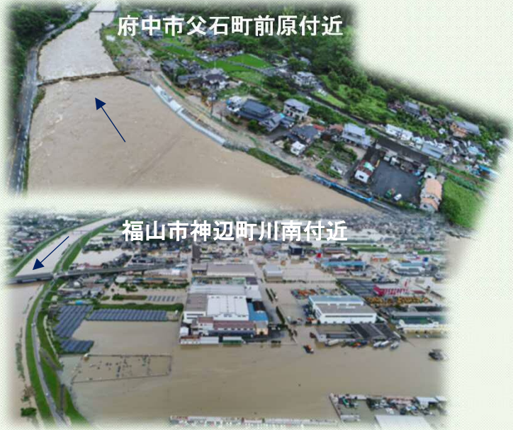
府中市父石町前原付近