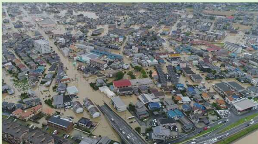
福山市山手町付近（平成30年7月豪雨）