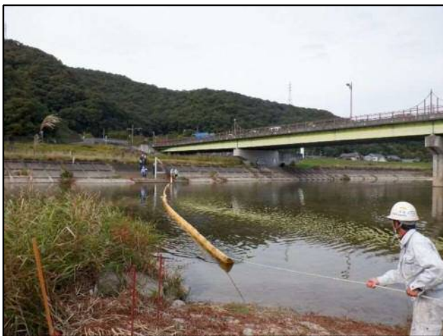
オイルフェンス展張訓練