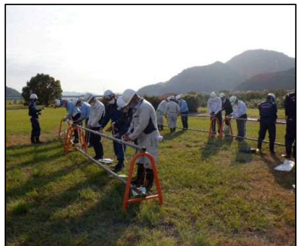
ロープワーク訓練