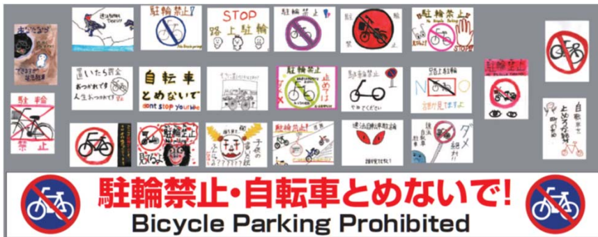
② 上り線側へ配置予定