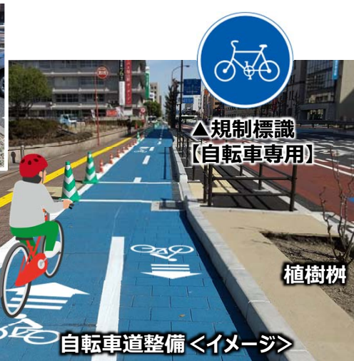
自転車道整備＜イメージ＞