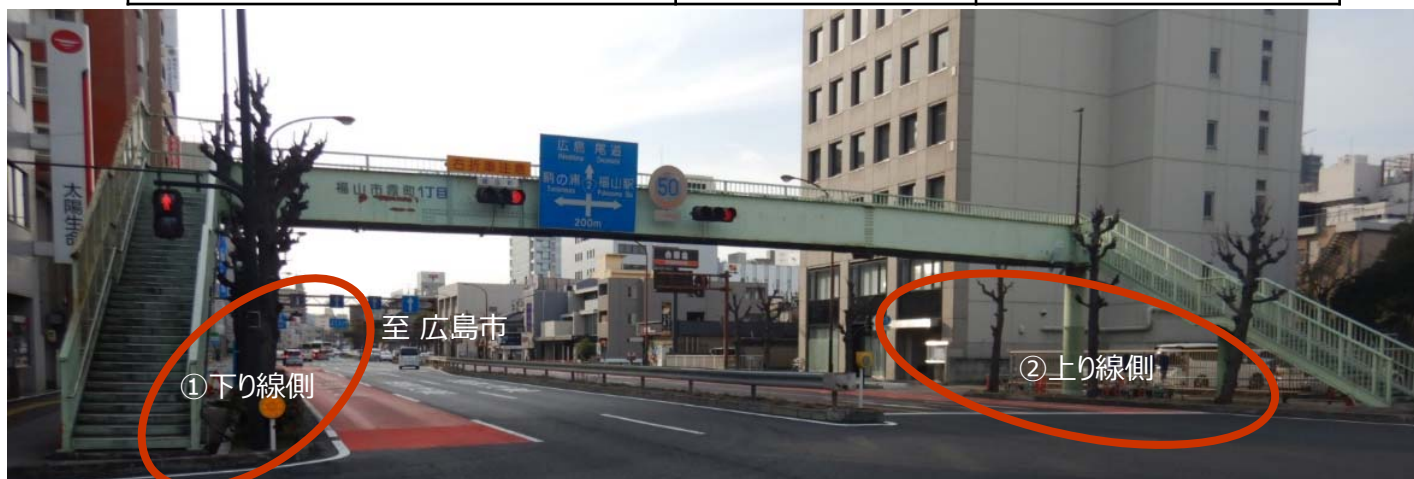
① 下り線側へ配置予定