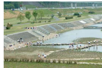
写真 6-4-1 ちゃぷちやぷらんど (福山市)

今後も、河川の特長や地域のニーズを反映させた河川整備の実現を目指すために、地域住民からの要望や意見を聴きながら、その意見を踏まえて整備に取り組みます。また、適正な河川管理を行っていく上で、地元自治体や地域住民、NPO 等の参画を推進し、役割分担をしながら、連携・協働の体制を強化します。