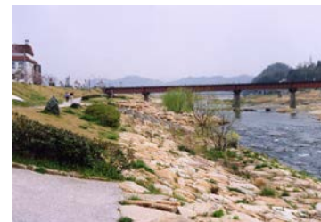
写真 6-4-3 府中市こどもの国 ポムポムの河川広場