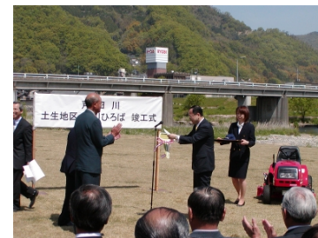
写真 6-4-2 土生地区環境整備事業 の竣工式（府中市）