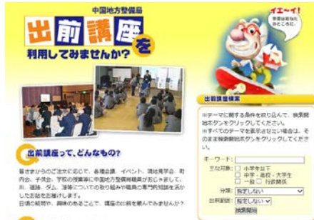
図 6-3-1 出前講座の案内

国全体の施策や方向に関するものから、生活に密着した防災、環境問題までバラエティに富んだ講座を「出前講座」として用意し、河川に関する学習を今後も支援します。