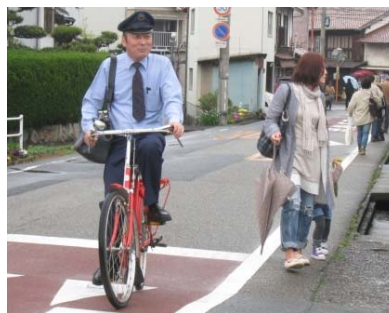
イベントでは定番の郵便屋さん