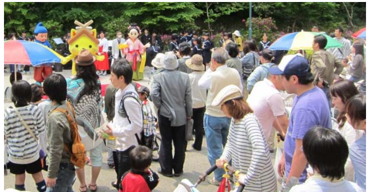
定着した活性化イベント「本町ふらり」