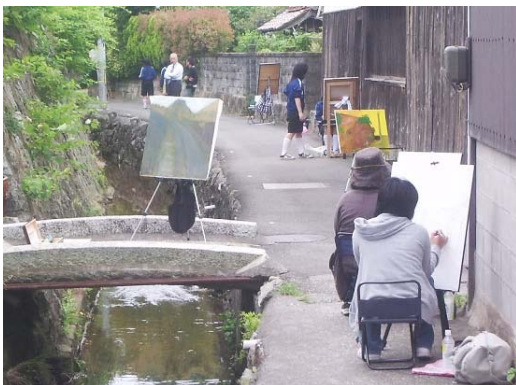
高校生の絵画研修風景

また、若者と一体に企画した地域活性化イベントの「本町ふらり」は10回目を数え、当初の500人規模から、今では2,000人を超える規模となり、江津市において定着した行事となるなど、これからも歴史を活かした更なる「郷土づくり」の進展が期待されます。