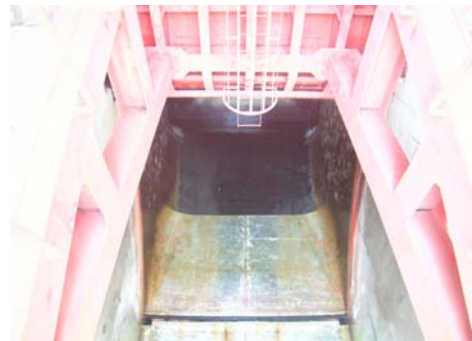
ゲートが開いている状態