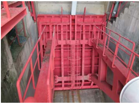
ゲートが閉まっている状態