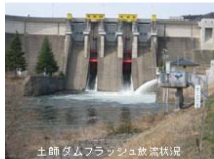
土師ダムフラッシュ放流状況