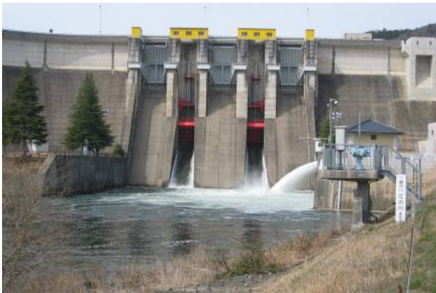
土師ダムフラッシュ放流状況