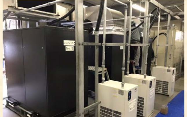
湖内に圧縮空気を送るコンプレッサー (超巨大な水槽のブクブクと言ったほうが理解しやすい??)