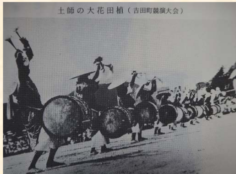
土師の大花田植(吉田町競演大会)

多くの牛たちと生活を共にしてきたほとんどの住民は、土師ダムの建設に伴い農業をやめたり、移転先によつては広い土地の確保や共同生産による生産体制が見通せなくなった