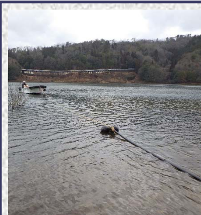
コンプレッサーから送られた空気を通す給気ホース(この後、水中に沈めます。)

土師ダム湖内で発生するアオコの抑制対策として設置してある曝気設備の空気圧縮機(コンプレッサー)の老朽化に伴う更新と湖内に空気を送る給気ホースの更新を行うものです。土師ダムには曝気設備が8基あり、今回はそのうちの2基の更新を行っています。工事は2月末で完了し、4月からの曝気設備の運転が出来るようになっていきます。