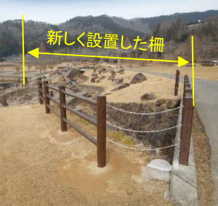
サイクリングロードに設置した転落防止柵 (フジの木を出来るだけ切らないように配慮)

土師ダム維持工事 施工業者…(株)高山 土師ダム周辺の草刈り・清掃・洪水により発生した流木やゴミの回収や樹木の伐採等1年を通じた維持管理を行っています。 現在は、のどごえ公園を管理している安芸高田市からの要望を受け、高低差があつて転落した場合に危険と想定される箇所に転落防止柵を設置する工事と、夏の花火大会で花火の発射台等にも使用される浮棧橋の床面の老朽化に伴う張替工事を行っています。また、前回紹介した警報所更新工事の基礎の施工も行っています。