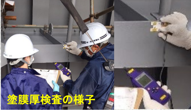
塗膜厚検査の様子