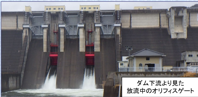
ダム下流より見た放流中のオリフィスゲート

点検は設備の損傷や異常の発見、作動確認を目的、触診、聴診、機器等による計測、作動テスト等により行います。点検により、不具合が見つかった場合は、整備等を行い、急な出水時にもゲートが確実に動くように準備しています。