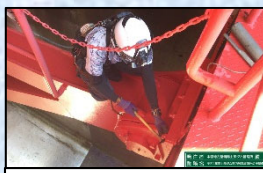
ボルトがゆるんでいないか点検しています