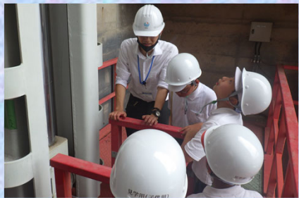
オリフィスゲートの大きさに驚く声も！

7月18日(火)、安芸高田市立川根小学校の4～6年生4名が、土師ダムに見学に来られました。見学前にダムの概要や役割などについて説明した後、実際にダムの堤体内や、放流設備、発電設備を見学して頂きました。児童の皆さんは職員の説明をメモを取りながら真剣に聞き、ダムの役割について多くの質問をしてもらいました。 ダムの中に入るのは、ほとんどの児童が初めての経験で、「夏なのに涼しい！」といった声がありました。冬も一定の温度だと知ると、「快適！」と、驚いた様子でした。