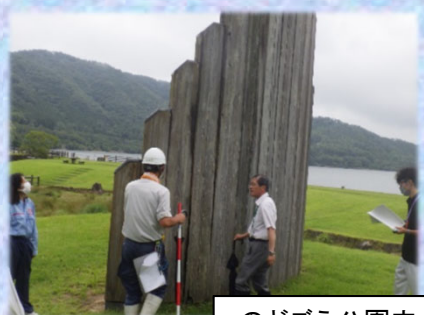
のどごえ公園内 施設の点検状況