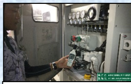
油圧ユニットの動作音の大きさを計測しています