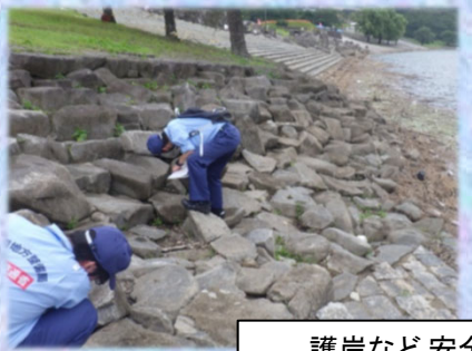
護岸など安全点検の状況