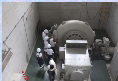
発電をする水車を間近で見ました！