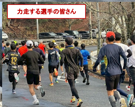
力走する選手の皆さん

12月14日(日) 第47回土師ダム湖畔マラソン大会が開催されました。 大会は、日本陸連公認コースの「ハーフ」「10km」の2部門で行われ、県内外から242名のランナーがエントリーされました。 当日は、開会式直前まで降っていた雨も上がり、選手の皆さんは、ダム湖周辺の景色を眺めながら、ダムの堤頂道路やのどえ公園を周回されました。 土師ダムは昨年完成50周年を迎えましたが、このマラソン大会も昭和61年から開催されており、ダムと共に歩んできた歴史の長いスポーツイベントです。 来年の大会は、開催40周年の記念の大会となりますので、多数のご参加をお待ちしております。