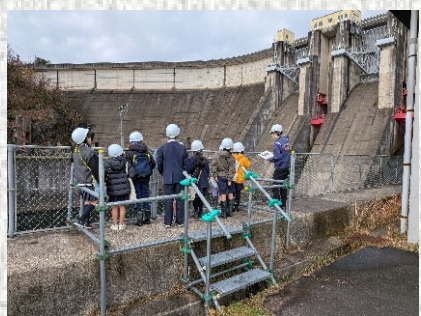
下からゲートの説明