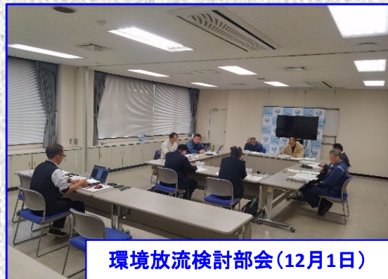
環境放流検討部会(12月1日)