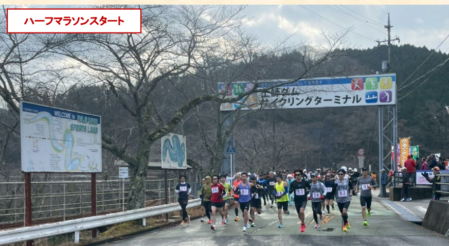
ハーフマラソンスタート