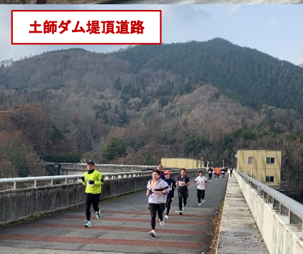
土師ダム堤頂道路