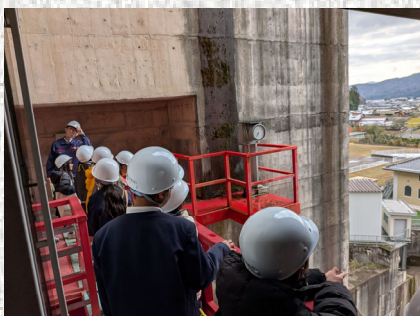
オリフィスゲート