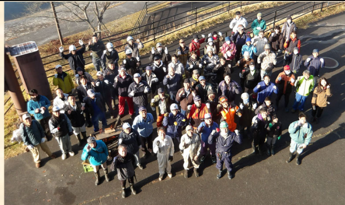
ボランティアの皆さん、ありがとうございました！