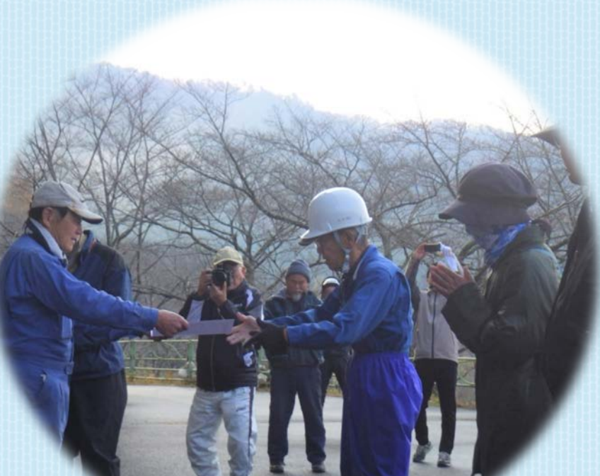
15回参加して下さった方々の表彰を行いました。 何度もご参加いただき、ありがとうございます！！