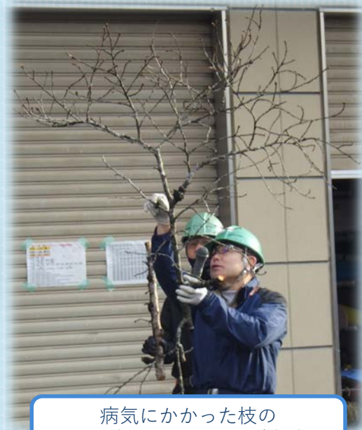
病気にかかった枝の見分け方を聞いて、いざ出陣⇒