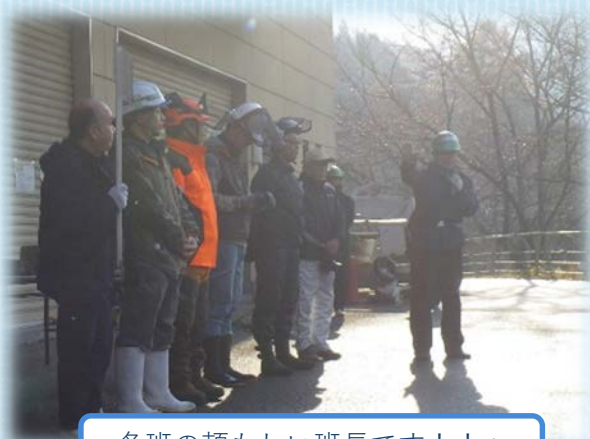
各班の頼もしい班長です！！☆