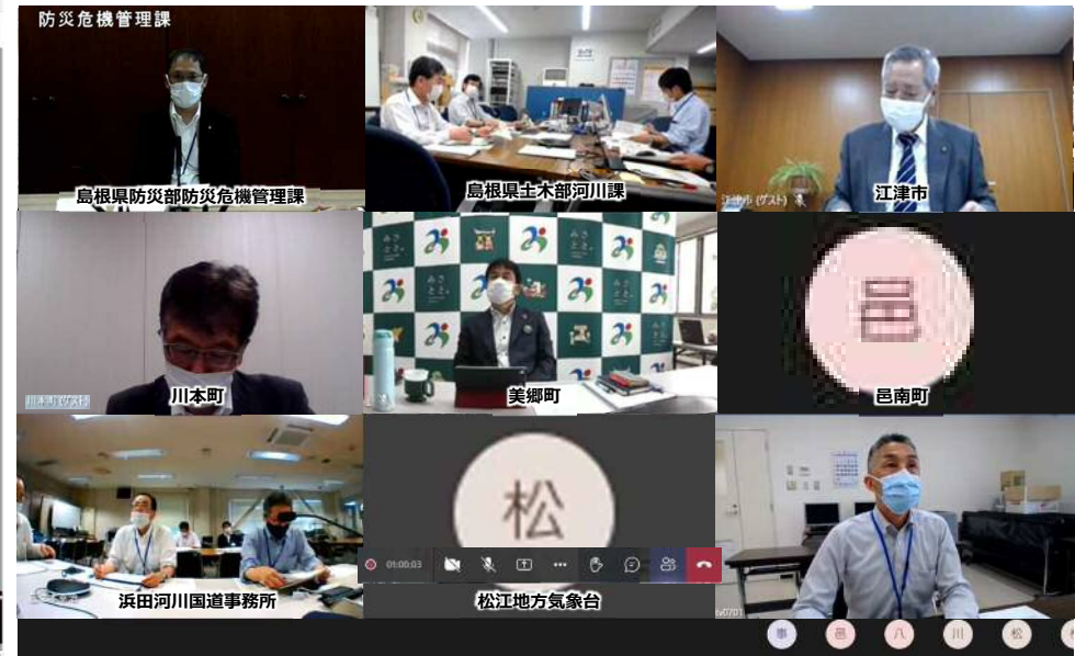
Web会議による「江の川水系(下流)大規模氾濫時の減災対策協議会」