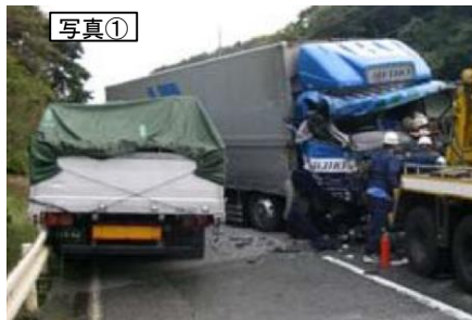
線形不良箇所による事故