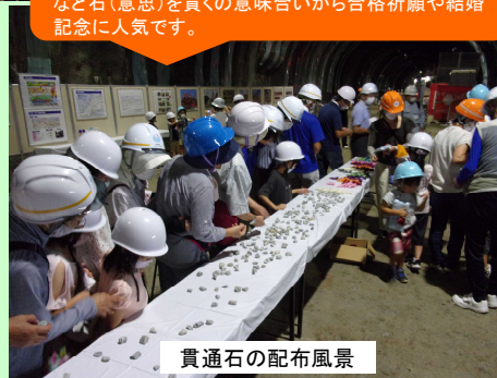
貫通石の配布風景

〈貫通石〉 トンネル貫通時の石として「難関突破」や「初志貫徹」など石(意思)を貫くの意味合いから合格祈願や結婚記念に人気です。