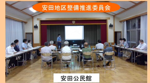
安田地区整備推進委員会