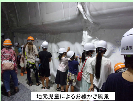
地元児童によるお絵かき風景

貫通と同時に外の光が差し込み、歓声が上がりました。また、各々貫通の瞬間をカメラに収めていました。