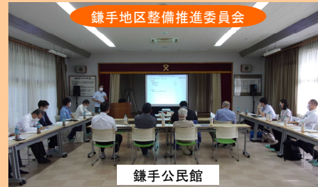
鎌手地区整備推進委員会

※整備推進委員会とは、三隅・益田道路事業を円滑に早期建設を図ることを目的として設立されています。 鎌手地区、安田地区と三隅地区の3つの委員会があり、地元の皆様と行政側(国、県、市)との架け橋的な役割として、地区の窓口取りまとめ、調整をお願いしています。