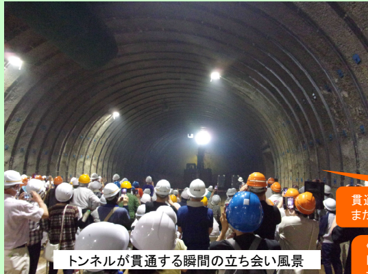
トンネルが貫通する瞬間の立ち会い風景

令和3年7月22日に岡見トンネル(仮称)(全長938m)の貫通イベントを開催し、地元の皆さん、ゆうひライン女性の会の皆さん、工事関係者など総勢約240名の方々にトンネル貫通の瞬間に立ち会っていただきました。 貫通イベントでは、貫通の立ち会い、記念撮影、貫通石の配布、地元児童によるトンネル壁面へのお絵かきを楽しんでいただきました。