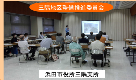
三隅地区整備推進委員会