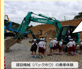
建設機械(バックホウ)の乗車体験