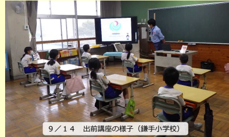
9/14 出前講座の様子(鎌手小学校)