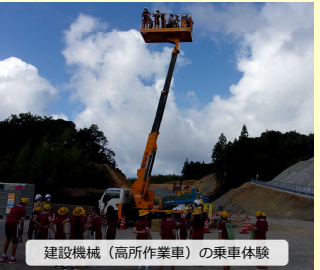
建設機械(高所作業車)の乗車体験

●三隅・益田道路についてのご質問、ご意見、だよりに対するご要望等ありましたら、下記までご連絡下さい。