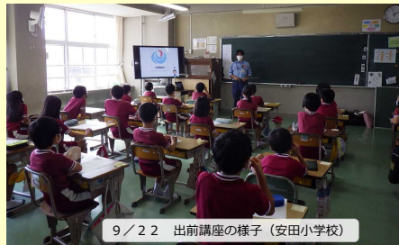
9/22 出前講座の様子(安田小学校)

●小学生からは、「三隅・益田道路を造るのに費用はいくら?」「三隅・益田道路が出来るとどれだけ早くなるの?」「建設機械の費用はいくら?」「現場見学に行くのが楽しみ。」「建設機械に乗りたい。」「道路が出来るのが楽しみ。」などの質問・感想があり講座に興味を持っていただきました。