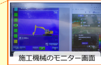
施工機械のモニター画面

3次元設計データとGPSの位置情報を使って、掘りすぎないように施工機械が制御され効率的に施工できることを紹介しました。