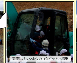
実際にバックホウのコックピットへ搭乗