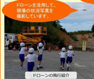
ドローンの飛行紹介