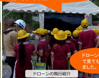
ドローンの飛行紹介