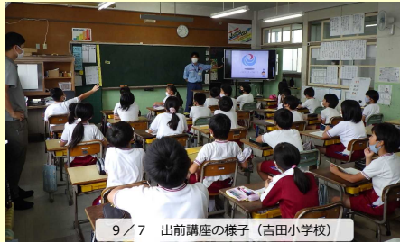
9/7 出前講座の様子(吉田小学校)

益田市の吉田小学校の4年生(105名)、鎌手小学校の3年生(7名)および安田小学校の5年生(47名)を対象に出前講座を開催しました。座学では山陰道の事業紹介や、現在工事中の「鎌手地区第5改良工事」の流れなどを学びました。