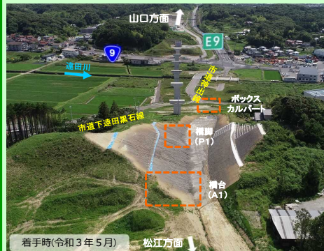
着手時(令和3年5月) 松江方面