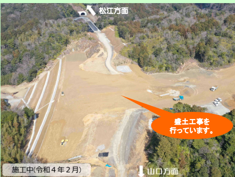
施工中(令和4年2月) 山口方面