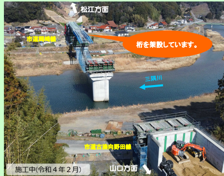
施工中(令和4年2月) 山口方面