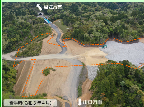
着手時(令和3年4月) 山口方面