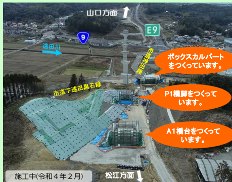
施工中(令和4年2月) 松江方面