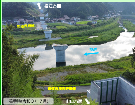
着手時(令和3年7月) 山口方面