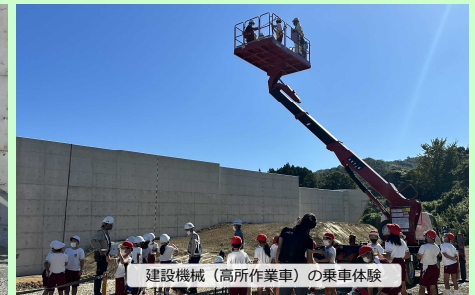
建設機械(高所作業車)の乗車体験