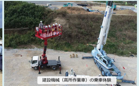
建設機械(高所作業車)の乗車体験

●三隅・益田道路についてのご質問、ご意見、だよりに対するご要望等ありましたら、下記までご連絡下さい。