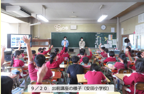
9/20 出前講座の様子(安田小学校)

益田市の安田小学校の4年生(34名)、吉田小学校の4年生(96名)を対象に出前講座を開催しました。座学では山陰道の事業紹介や、現在工事中の「鎌手IC改良工事」の流れなどを学びました。