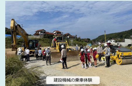
建設機械の乗車体験