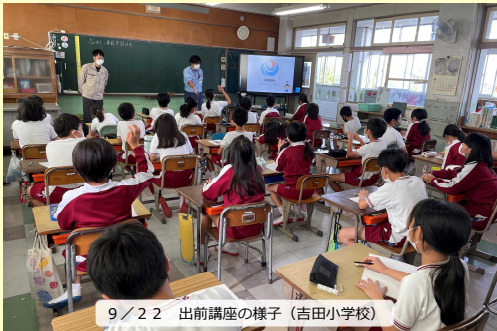
9/22 出前講座の様子(吉田小学校)

●小学生からは、「現場見学に行くのが楽しみ。」「建設機械に乗りたい。」「道路が出来るのが楽しみ。」「色々な新しい発見があった。」などの感想があり講座に興味を持っていただきました。