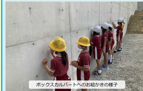
ボックスカルバートへのお絵かきの様子