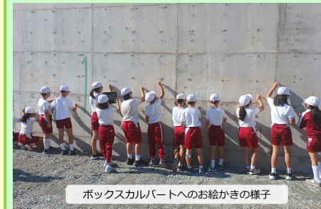
ボックスカルバートへのお絵かきの様子