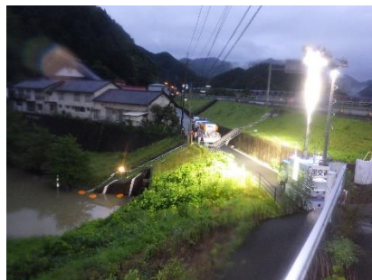
江の川排水ポンプ車・照明車稼働状況（令和2年7月）