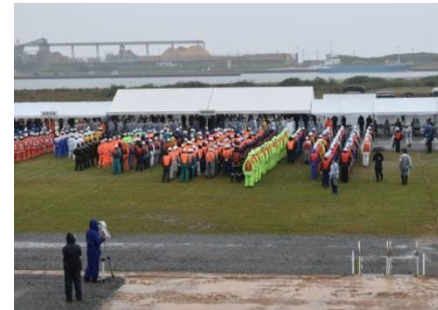
江の川下流総合水防演習（平成30年5月）