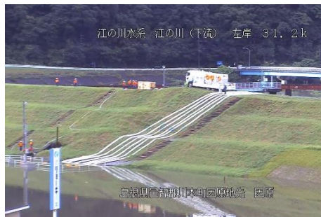
江の川排水ポンプ車稼働状況（令和2年7月）