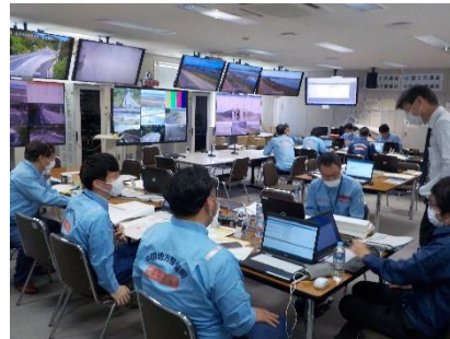
災害対策演習状況