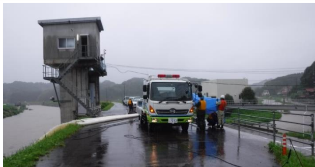
高津川排水ポンプ車稼働状況（平成30年7月）

出水期前には防災体制に万全を期すため、関係機関とともに災害対策演習を実施しています。