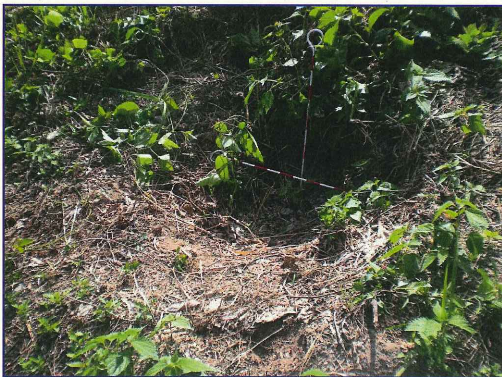
江の川 イノシシによる掘り返し