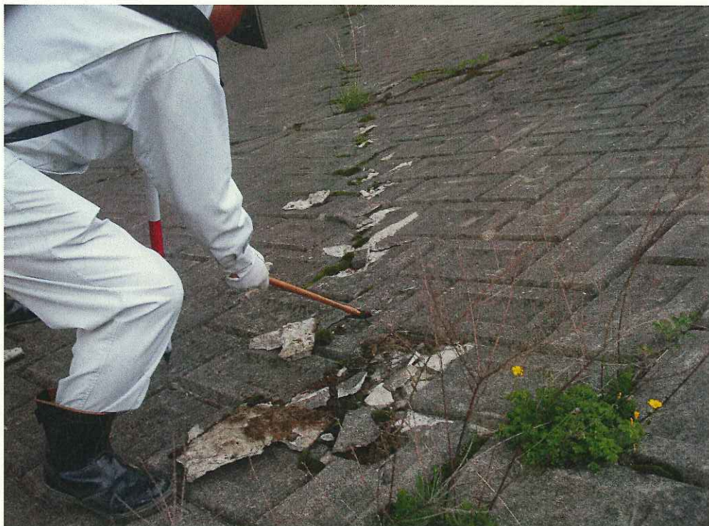
江の川 コンクリート護岸にクラック