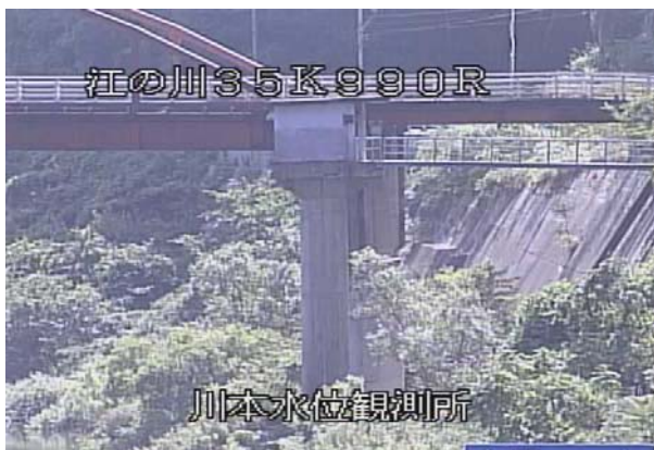
設 置 前