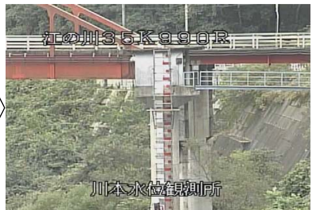
設 置 中