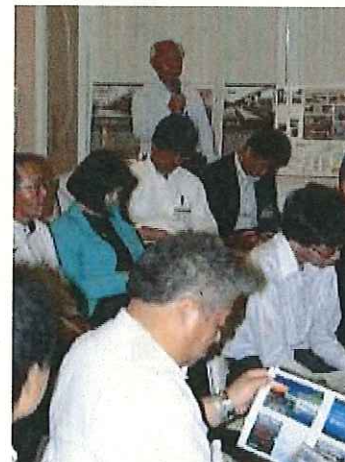
(意見交換会の様子)