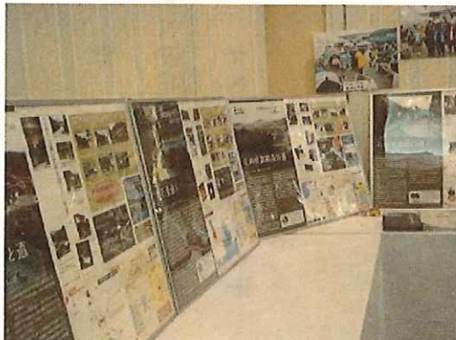
(会場内のパネル展示)