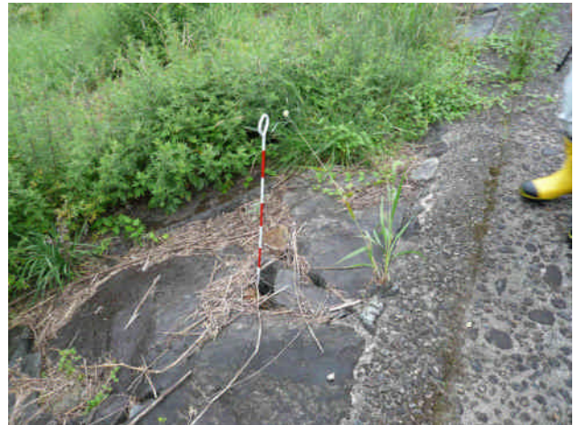
吸い出し箇所の間詰め(川本町木路原)