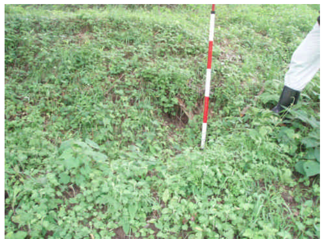
斜面にくぼみ(美郷町亀村)