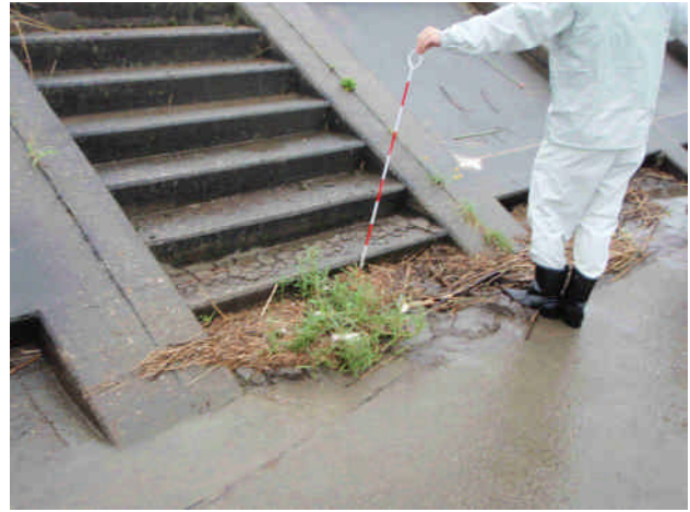
階段部に土砂の堆積(江津市江津町)