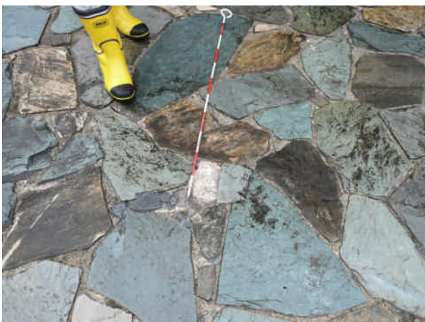
石板のはがれ(川本町木路原)