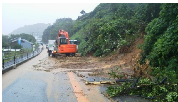
島根県江津市(国道9号) 復旧作業