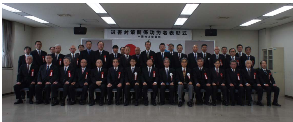
2月17日(月) 広島合同庁舎で行われた 表彰式の写真