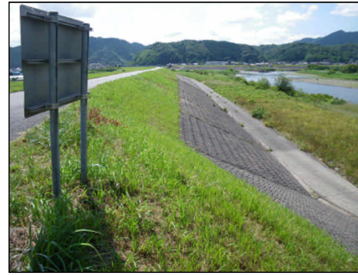
高津川(益田市横田町)