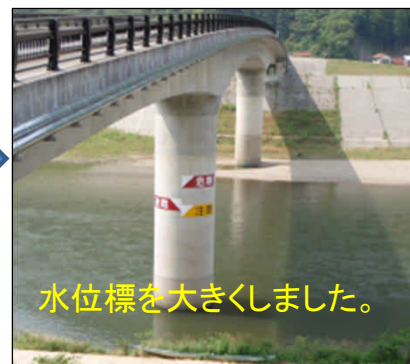
水位標を大きくしました。