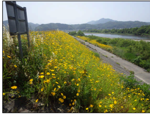
高津川(益田市横田町)