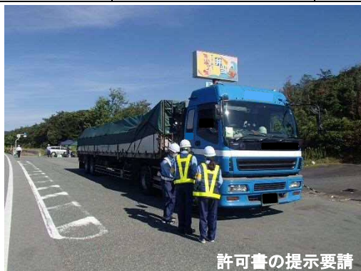
許可書の提示要請