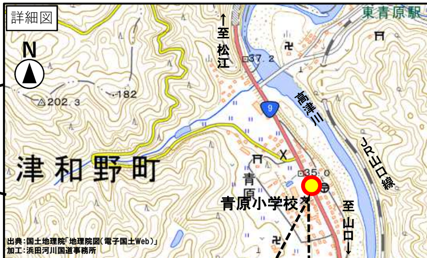
国道9号 青原横断歩道橋