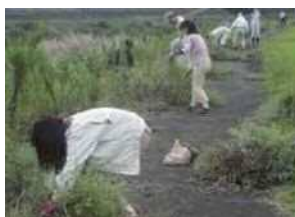
外来植物調査・駆除

水生生物の調査研究や、生態系を維持するために外来生物の駆除活動などを行い、河川の環境を維持します。