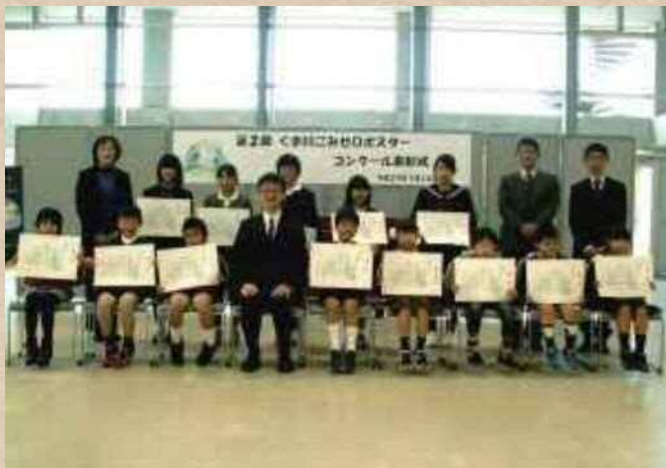
【熊本県】球磨川 次世代のためにがんばる会

河川協力団体は市民と河川管理者、双方の立場を理解し、活動しています。市民と河川管理者の間に立つことで、お互いの視点や想いを融合することが出来ます。その結果、河川の利活用や維持・管理につながります。