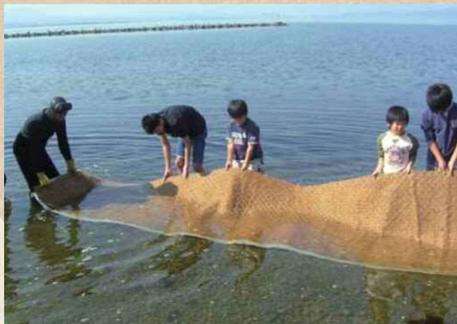
【鳥取県・島根県】中海 NPO法人 未来守りネットワーク

河川協力団体によるアマモ場再生への取り組み。作業に地域の子ども達も参加することで、自分達が住む地域への関心や、自然環境に対する意識の向上につながっている。