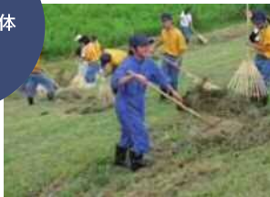
河川の除草・集草