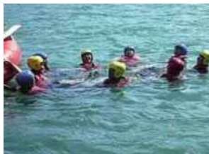
水辺の安全利用講習会

河川や河川空間を使って、観察会や、安全に河川を利用するための講習会などを実施します。