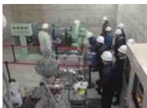
河川・ダム管理状況説明

過去の水害などの伝承や、防災に関わる活動、またダムなど河川にある施設での説明会などを実施します。