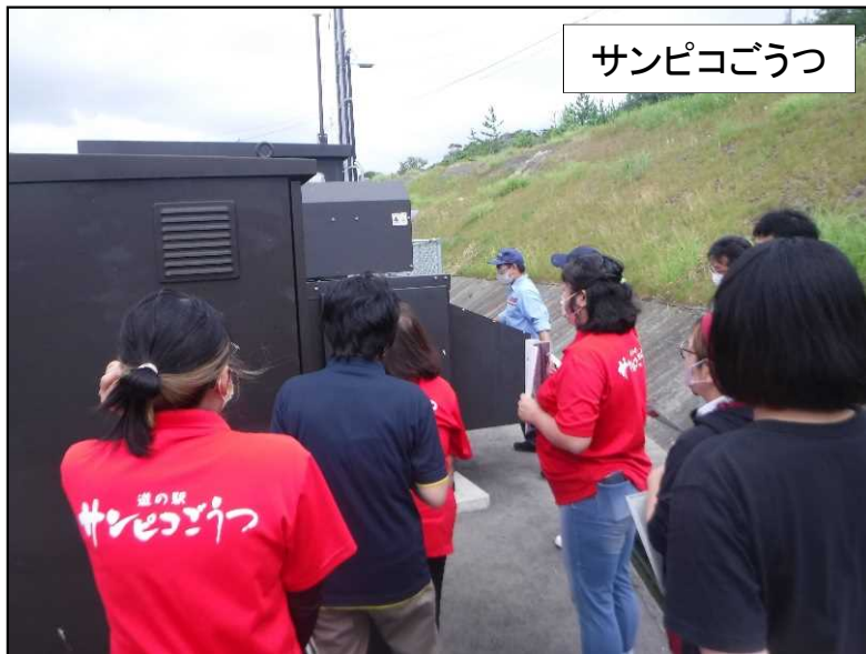
非常用電源設備の説明の様子