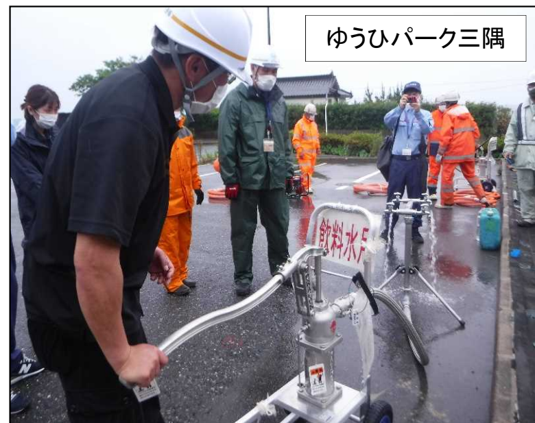
貯水タンクの操作訓練の様子