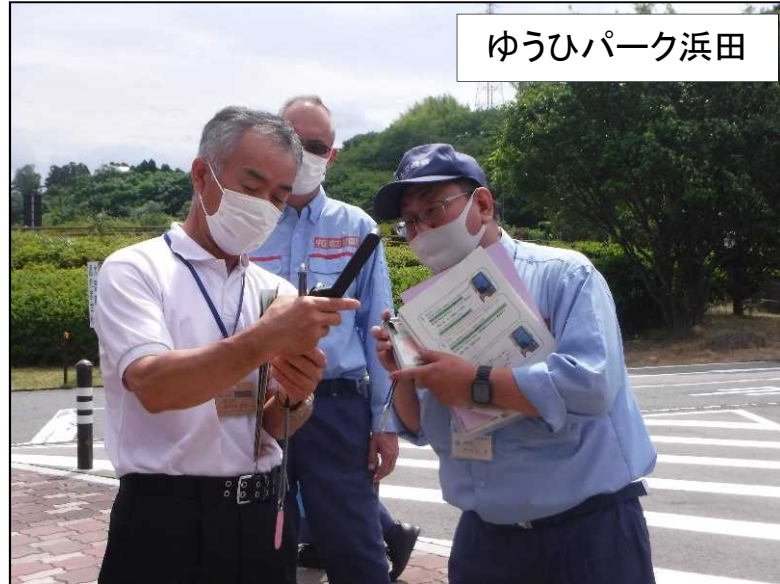
衛星携帯電話操作説明の様子