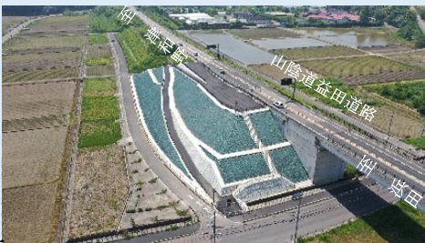
【山陰道益田道路緊急避難場所】