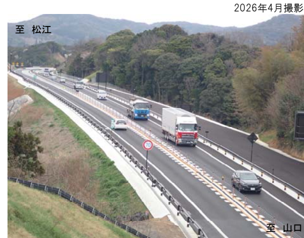
写真1 三隅・益田道路利用状況 (遠田IC付近)