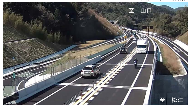
三隅・益田道路利用状況（岡見IC付近）