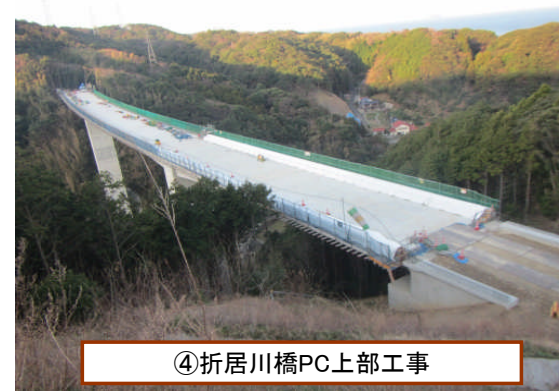
④折居川橋PC上部工事