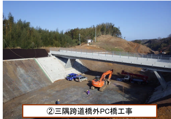
②三隅跨道橋外PC橋工事