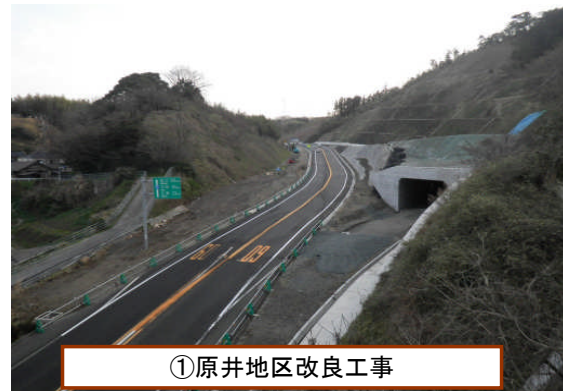
①原井地区改良工事