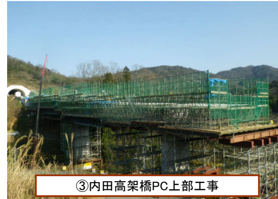
③内田高架橋PC上部工事