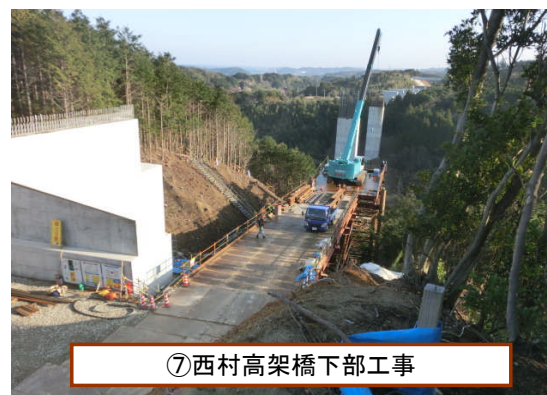
⑦西村高架橋下部工事