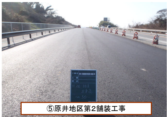
⑤原井地区第2舗装工事