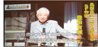
地域にゆかりの深い方々からの ビデオレター