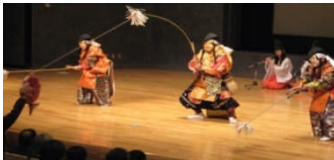
西村子供神楽社中 石見神楽の祝い演目「恵比寿」