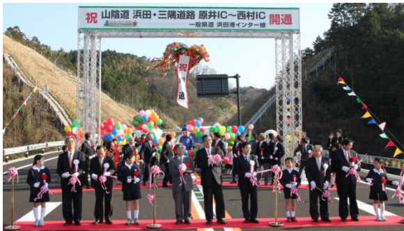
テープカット・くす玉割り・風船奉天