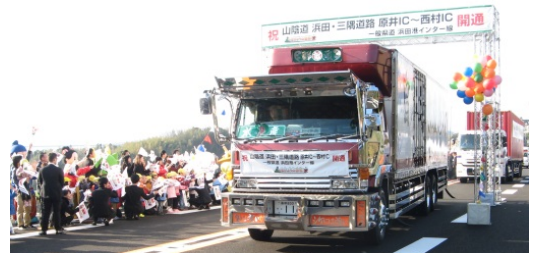
地域の働く車によるパレード