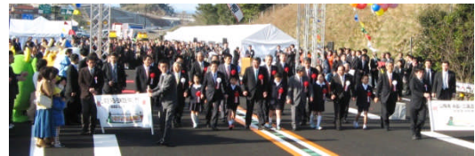
子ども達からのつなげよう山陰道！メッセージの披露