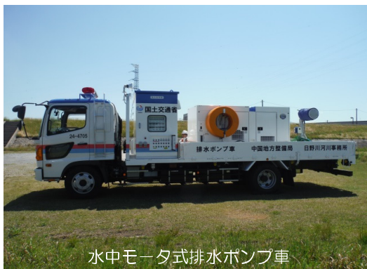
水中モータ式排水ポンプ車