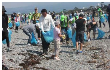
海岸環境の維持 (清掃活動)