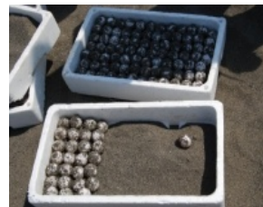
希少種保護 (ウミガメ卵の保護)