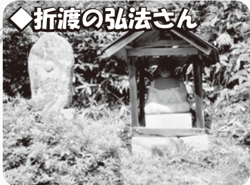
折渡の弘法さんは大宮振興センターから西方向に約5km