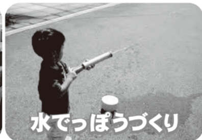
水でっぼうづくり