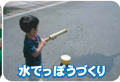
水でっぼうづくり