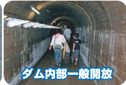
ダム内部一般開放