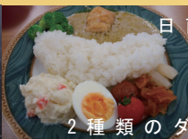
日南町 2種類のダムカレー