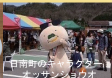
日南町のキャラクター オッサンショウオ