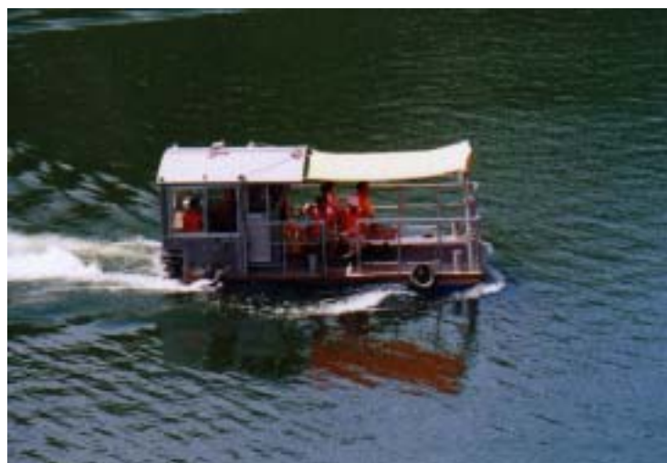
ダム湖遊覧の様子