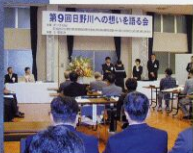
日野川フォトコンテスト表彰式