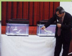
会場に展示された日野川に生息する魚