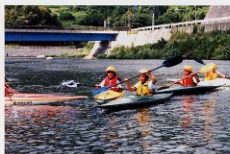
“カヌーの広場”で楽しむ子ども達

日野町は、日野川の支流にある3つの場所を紹介します。1つ目は、“カワコふれあい公園”です。いろいろなイベントを行っていますが、この場所は防災関係にも使用できるよう、ヘリコプターが難着をする場所として整備されています。管理については、地元の方々が自発的に草取りや整備を行い、夏には子どもたちを集めて魚のつかみ取りなどを行っています。